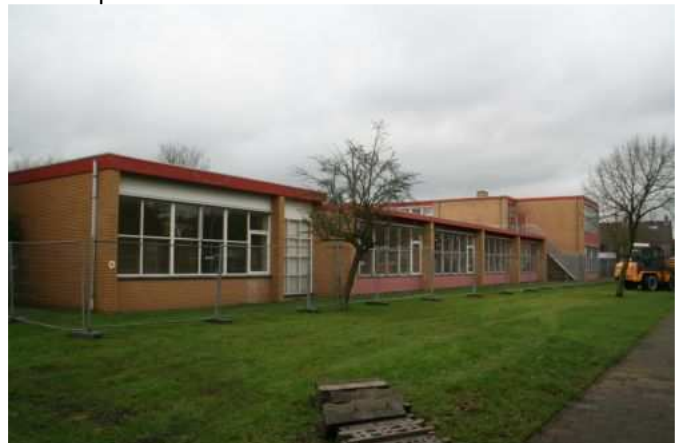
- Er wordt gehekt -

die het voordeel (of het nadeel) heeft aan de overkant van de bouwplaats te wonen