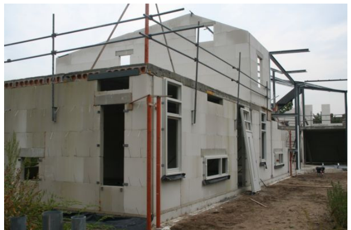
Leuk: aquarium ramen. Staalwerk boven de trap die uit gaat kragen is ook te zien.