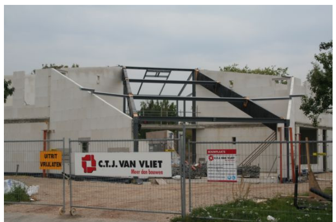
Donderdagmiddag 17:00 uur: er is weer actie geweest en dat is te zien.