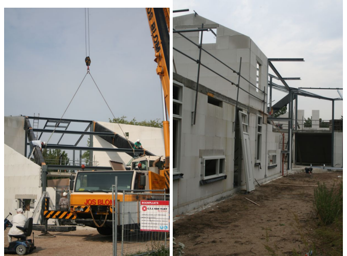
Staalwerk en kozijnen