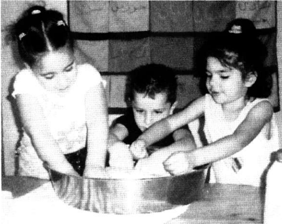
Samen brood kneden

In Shfara'm, een stadje in het zuidelijke gedeelte van Galilea, Israël, wonen ongeveer 30.000 mensen, voor het grootste deel Arabische moslims, christenen en druzen. In dit stadje is sinds 2004 de eerste Arabische Waldorfschool, El Zeitoun (= de Olijfbom) gevestigd. Deze tweetalige school neemt alle kinderen op ongeacht hun achtergrond, religie of milieu. Daarmee behoort El Zeitoun samen met Ein Bustan, een joods-Arabisch Waldorfschooltje in Hilf, tot de enige twee volledig interculturele Waldorfscholen in Israël.