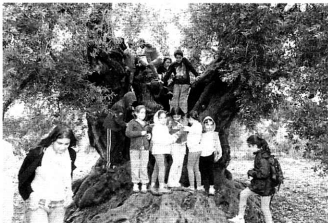
De olijfboom, symbool van El Zeitoun

De droom die wij, ouders en medewerkers van de school, voor de toekomst koesteren is, dat dit Waldorfinitiatief ons zal helpen om de pijnlijke muren, zichtbare en onzichtbare, tussen de verschillende bevolkingsgroepen in Israël en vooral die tussen joodse en Palestijnse inwoners, te slechten. Ook dromen wij ervan dat onze Arabische school navolging krijgt in andere dorpen en steden in